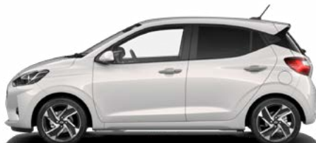
Lumen Gray Pearl Kontrastdach verfügbar