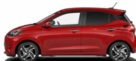
Dragon Red Pearl Kontrastdach verfügbar