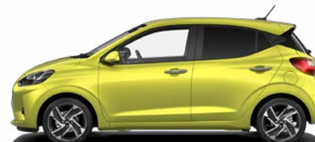
Lucid Lime Metallic Kontrastdach verfügbar