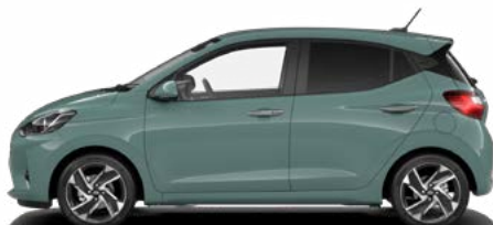
Mangrove Green Pearl Kontrastdach verfügbar