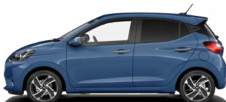
Vibrant Blue Pearl Kontrastdach verfügbar