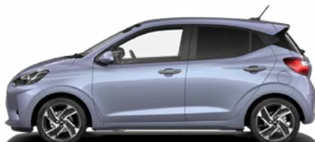
Meta Blue Pearl Kontrastdach verfügbar nicht für N Line