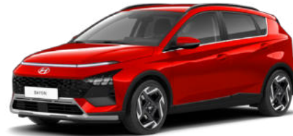
Fierce Red Pearl Kontrastdach verfügbar