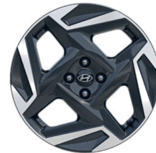
Comfort Line (optional) 17" Leichtmetallfelgen