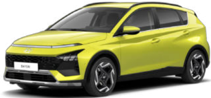
Lucid Lime Metallic