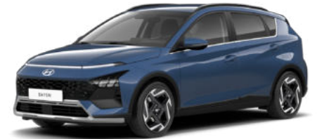
Vibrant Blue Pearl