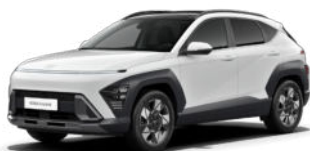
Serenity White Pearl Kontrastdach verfügbar