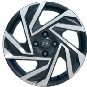
Comfort Line 16" Leichtmetallfelge