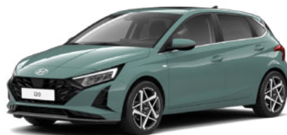
Mangroove Green Pearl Kontrastdach verfügbar