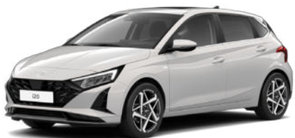
Lumen Gray Pearl Kontrastdach verfügbar