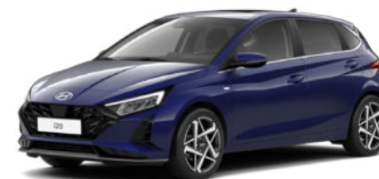
Vibrant Blue Pearl Kontrastdach verfügbar