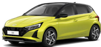
Lucid Lime Metallic Kontrastdach verfügbar