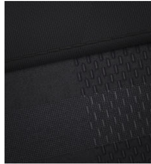
Comfort Line Stoffpolsterung Schwarz