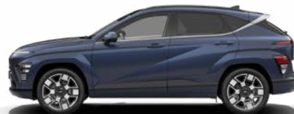
Sailing Blue Pearl