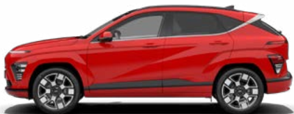
Engine Red Solid