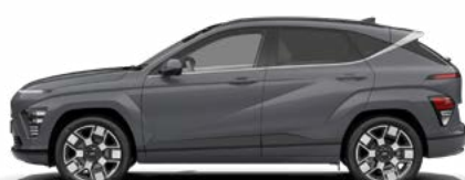
Ecotronic Gray Pearl