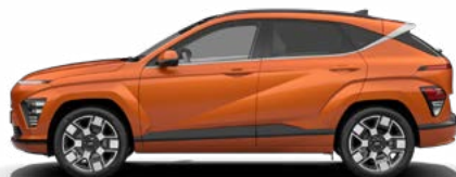
Jupiter Orange Metallic