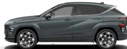
Cypress Green Pearl