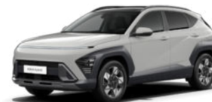
Shimmering Silver Metallic Kontrastdach verfügbar