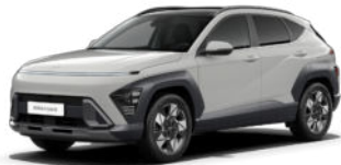
Quantum Gray Pearl Kontrastdach verfügbar