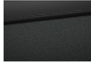
Comfort Line (optional) Stoff-/ Leder Kombination 2) Schwarz