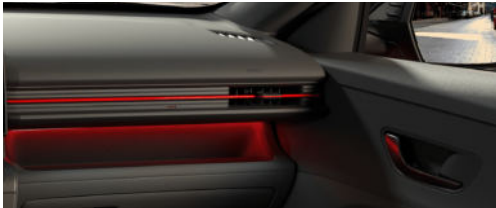
N Line Interieur Schwarz mit roten Akzenten