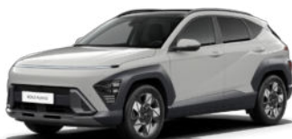
Cyber Gray Metallic Kontrastdach verfügbar