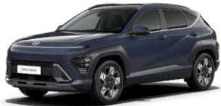
Denim Blue Pearl Kontrastdach verfügbar