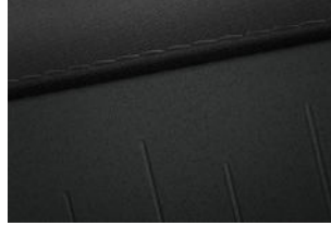
Comfort Line Stoff Schwarz