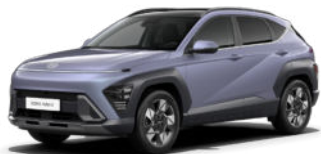
Meta Blue Pearl Kontrastdach verfügbar nicht verfügbar für N Line