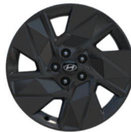
Comfort Line (optional) 18" Leichtmetallfelge in Schwarz