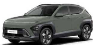
Amazonas Gray Metallic Kontrastdach verfügbar nicht verfügbar für N Line