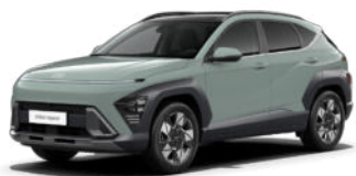
Mirage Green Pearl Kontrastdach verfügbar