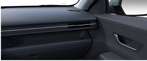
Smart / Comfort Line Interieur Schwarz