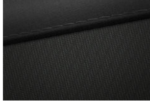
Smart Line Stoff Schwarz