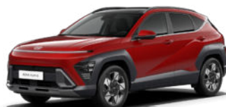
Ultimate Red Metallic Kontrastdach verfügbar