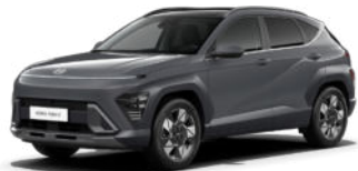
Ecotronic Gray Pearl Kontrastdach verfügbar