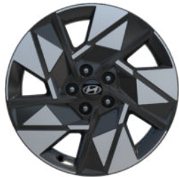
Comfort Line 18" Leichtmetallfelge