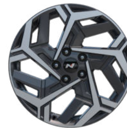
N Line 18" Leichtmetallfelge N Line