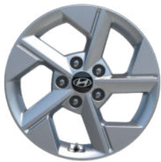
Smart Line 16" Leichtmetallfelge