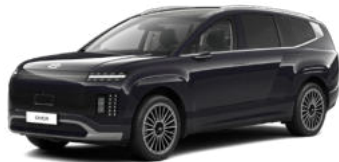
Biophilic Blue Pearl