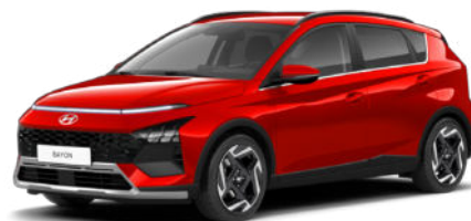
Fierce Red Pearl Kontrastdach verfügbar