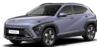
Meta Blue Pearl Kontrastdach verfügbar nicht verfügbar für N Line