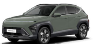
Amazonas Gray Metallic Kontrastdach verfügbar nicht verfügbar für N Line