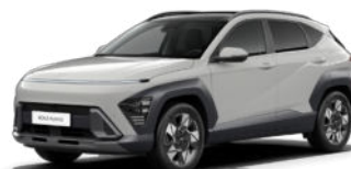
Cyber Gray Metallic Kontrastdach verfügbar