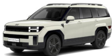
Cyber Sage Pearl