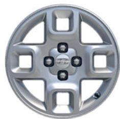
Smart Line (optional) / Comfort Line 15" Leichtmetallfelge