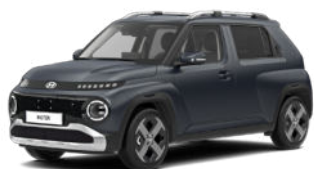
Dusk Blue Matte nicht für Cross Line