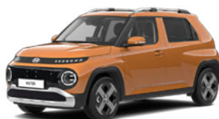
Sienna Orange Metallic nicht für Cross Line