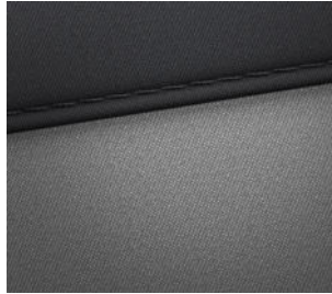
Smart Line Stoffpolsterung