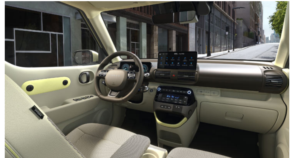
Österreichmodell gemäß aktueller Preisliste

UVP - Unverbindlicher Verkaufspreis in EUR inkl. MwSt., NoVA und Transportkosten.