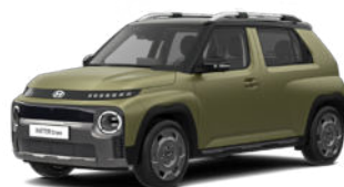
Amazonas Green Matte nur für Cross Line

Pflegehinweis bei Fahrzeugen mit Mattlackierung: Autowaschanlagen mit drehenden Bürsten dürfen nicht verwendet werden, da sie die Oberfläche Ihres Fahrzeugs beschädigen können. Dampfreiniger, die die Fahrzeugoberfläche mit hohen Temperaturen reinigen, können dazu führen, dass Öl auf dem Lack haftet und schwer zu entfernende Flecken bildet. Verwenden Sie bei der Autowäsche ein weiches Tuch (z. B. Mikrofaser Tuch oder Schwamm) und trocknen Sie das Auto mit einem Mikrofaser Tuch. Wenn Sie Ihr Auto von Hand waschen, sollten Sie keinen Reiniger verwenden, der mit einer Wachsbehandlung abschließt. Wenn die Fahrzeugoberfläche stark verschmutzt ist (Sand, Schmutz, Staub, Verunreinigungen usw.), spülen Sie die Oberfläche zunächst mit Wasser, bevor Sie das Fahrzeug waschen. Verwenden Sie keinen Lackschutz (wie Schaumwaschmittel), Scheuermittel oder Politur. Wurde Wachs aufgetragen, entfernen Sie das Wachs umgehend mit einem Silikonreiniger. Wenn Teer oder Teerverunreinigungen vorliegen, verwenden Sie zu deren Entfernung einen geeigneten Teerentferner. Achten Sie jedoch darauf, nicht zu viel Druck auf die Lackierung auszuüben.