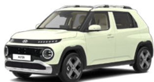
Buttercream Yellow Pearl nicht für Cross Line