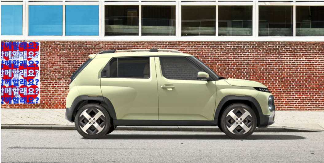
Österreichmodell gemäß aktueller Preisliste