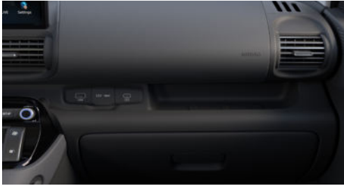
Smart / Comfort Line Interieur Schwarz