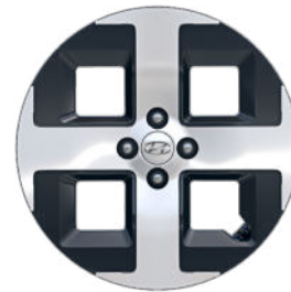
Comfort Line (optional) / Cross Line 17" Leichtmetallfelge