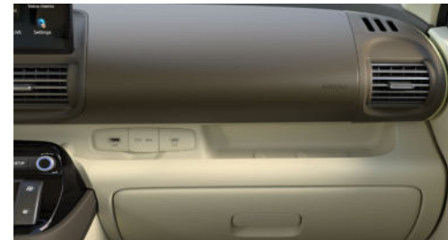
Comfort Line Interieur Newtro Beige / Khaki Brown