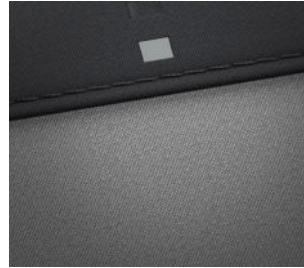
Comfort Line Stoffpolsterung