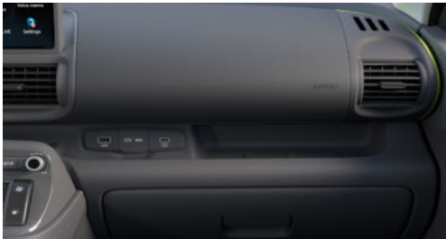
Cross Line Interieur Dark Pebble Gray