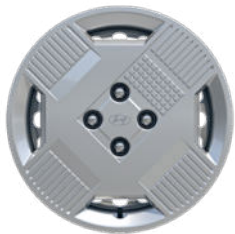
Smart Line 15" Radzierkappe