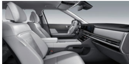
Prestige Line Lederinnenausstattung 7) Supersonic Gray