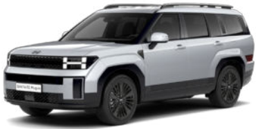
Typhoon Silver Metallic