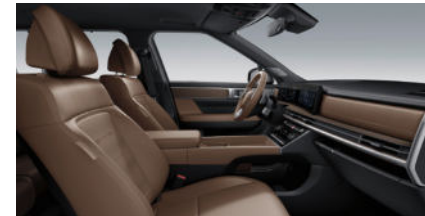
Calligraphy Nappa Lederinnenausstattung 7) Pecan Brown