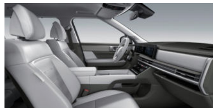
Calligraphy Nappa Lederinnenausstattung 7) Forest Green