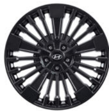
Calligraphy 20" Leichtmetallfelge in Schwarz