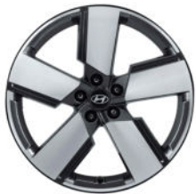
Trend Line / Prestige Line 20" Leichtmetallfelge