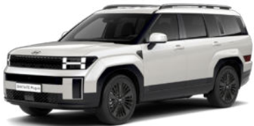
Creamy White Pearl