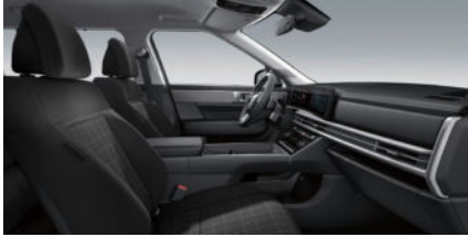
Trend Line Stoffpolsterung Schwarz