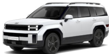
Creamy White Matte