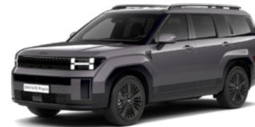
Ecotronic Gray Pearl