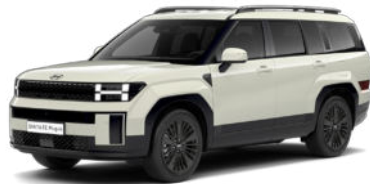
Cyber Sage Pearl