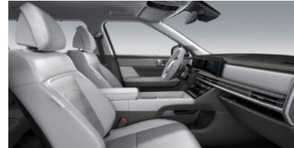
Prestige Line Lederinnenausstattung 7) Forest Green