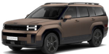
Earthy Brass Matte