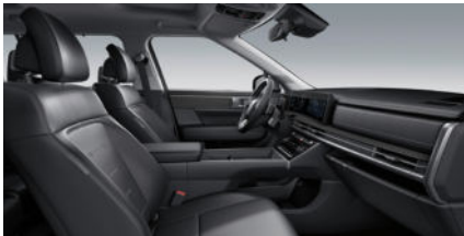
Calligraphy Nappa Lederinnenausstattung 7) Schwarz