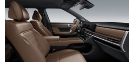
Prestige Line Lederinnenausstattung 7) Pecan Brown