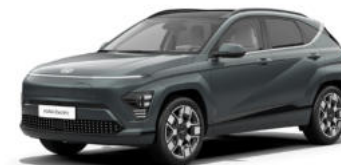
Cypress Green Pearl Kontrastdach verfügbar nicht verfügbar für N Line