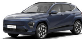
Sailing Blue Pearl Kontrastdach verfügbar