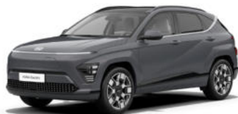
Ecotronic Gray Pearl Kontrastdach verfügbar