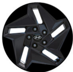
Smart Line (optional) 17" Leichtmetallfelge in Schwarz