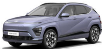
Meta Blue Pearl Kontrastdach verfügbar nicht verfügbar für N Line