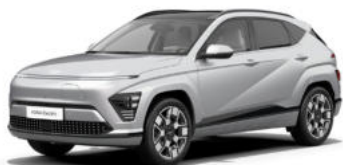
Shimmering Silver Metallic Kontrastdach verfügbar