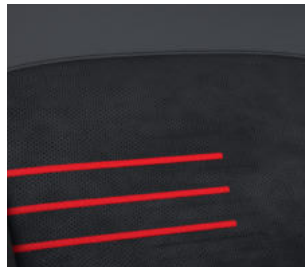
N Line Leder-/ Alcantara 9) Kombination