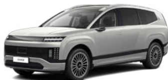
Gravity Gold Matte nur für Prestige Line und Calligraphy