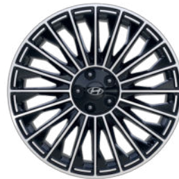
Calligraphy 21" Leichtmetallfelge

UVP - Unverbindlicher Verkaufspreis in EUR inkl. MwSt., NoVA und Transportkosten.