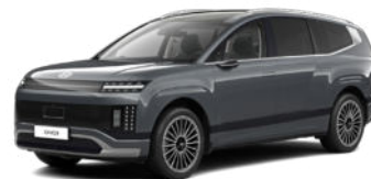
Nocturne Gray Metallic