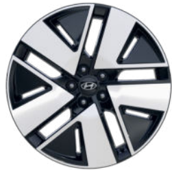
Prestige Line 20" Leichtmetallfelge