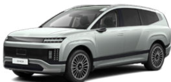
Celadon Gray Matte nur für Prestige Line und Calligraphy