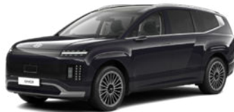
Biophilic Blue Pearl