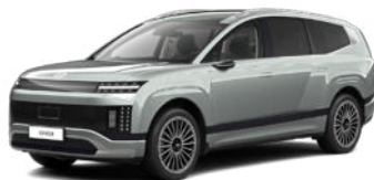
Celadon Gray Metallic