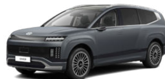
Nocturne Gray Matte nur für Prestige Line und Calligraphy

Pflegehinweis bei Fahrzeugen mit Mattlackierung: Autowaschanlagen mit drehenden Bürsten dürfen nicht verwendet werden, da sie die Oberfläche Ihres Fahrzeugs beschädigen können. Dampfreiniger, die die Fahrzeugoberfläche mit hohen Temperaturen reinigen, können dazu führen, dass Öl auf dem Lack haftet und schwer zu entfernende Flecken bildet. Verwenden Sie bei der Autowäsche ein weiches Tuch (z. B. Mikrofaser Tuch oder Schwamm) und trocknen Sie das Auto mit einem Mikrofaser Tuch. Wenn Sie Ihr Auto von Hand waschen, sollten Sie keinen Reiniger verwenden, der mit einer Wachsbehandlung abschließt. Wenn die Fahrzeugoberfläche stark verschmutzt ist (Sand, Schmutz, Staub, Verunreinigungen usw.), spülen Sie die Oberfläche zunächst mit Wasser, bevor Sie das Fahrzeug waschen. Verwenden Sie keinen Lackschutz (wie Schaumwaschmittel), Scheuermittel oder Politur. Wurde Wachs aufgetragen, entfernen Sie das Wachs umgehend mit einem Silikonreiniger. Wenn Teer oder Teerverunreinigungen vorliegen, verwenden Sie zu deren Entfernung einen geeigneten Teerentferner. Achten Sie jedoch darauf, nicht zu viel Druck auf die Lackierung auszuüben.