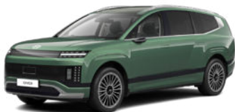
Ionosphere Green Pearl