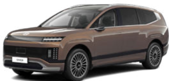
Sunset Brown Pearl