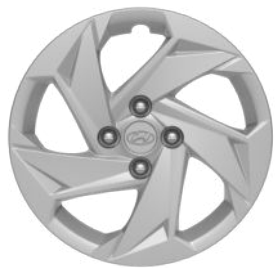
Smart Line 15" Stahlfelgen mit Radzierkappe