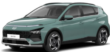
Mangroove Green Pearl Kontrastdach verfügbar