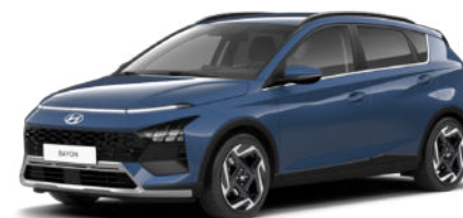
Vibrant Blue Pearl