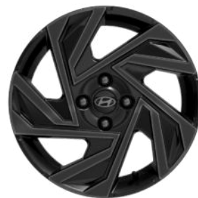
Smart Line / Comfort Line (optional) 16" Leichtmetallfelgen in Schwarz