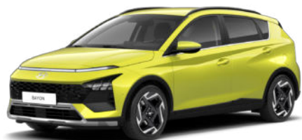
Lucid Lime Metallic