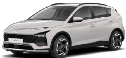
Lumen Gray Pearl Kontrastdach verfügbar