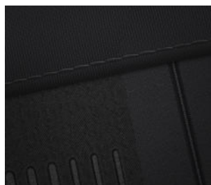
Comfort Line Stoffpolsterung Schwarz