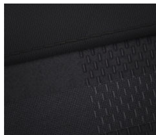
Smart Line Stoffpolsterung Schwarz / Grau