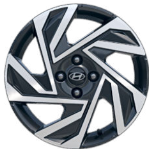
Comfort Line 16" Leichtmetallfelgen