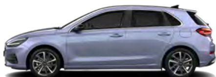
Meta Blue Pearl