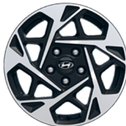
16" Leichtmetallfelgen GO!