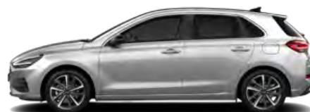
Shimmering Silver Metallic