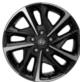
17" Leichtmetallfelgen GO! Plus