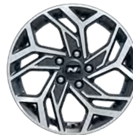
17" Leichtmetallfelgen N Line (1.0 T-GDI MT)