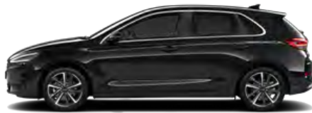
Abyss Black Pearl