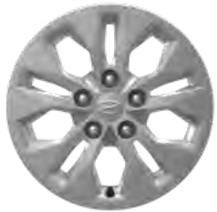
15" Stahlfelge (Radzierkappe) Smart Line