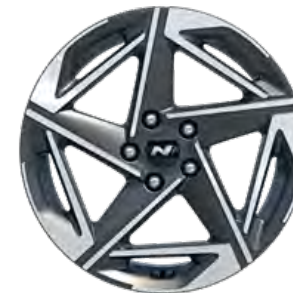
18" Leichtmetallfelgen N Line (1.6 T-GDI DCT)

2) Die vom Hersteller angebotene kostenlose Aktualisierung des Kartenmaterials des werksseitig eingebauten Navigationssystems ist unter https://update.hyundai.com/EU/DE/ abrufbar und kann selbst durchgeführt werden, bzw. einmal jährlich im Rahmen der regelmäßigen Wartung beim Hyundai-Partner. 3) Android Auto TM ist ein eingetragenes Warenzeichen von Google Inc., Apple CarPlay TM ist ein eingetragenes Warenzeichen von Apple Inc. 4) Bluetooth TM ist eine eingetragene Marke von Bluetooth SIG, Inc. – sofern Apple CarPlay TM bzw. Android Auto TM in der Serienausstattung verfügbar, ist die Spracherkennung darüber möglich. 5) Bluelink Funktionen (OTA-update, Live-Service, Sprachsteuerung, etc) stehen unentgeltlich für einen Testzeitraum von maximal sechs Monaten ab Beginn der Garantielaufzeit zur Verfügung, danach stehen diese abhängig vom gewählten Bluelink-Paket zur Verfügung. 6) Nicht kompatibel mit allen Mobiltelefonen. 7) Leder: Echtleder kombiniert mit hochwertigem Leder- oder Kunstleder. 8) Leder-/Alcantara Kombination: Echtleder kombiniert mit hochwertigem Kunstleder.