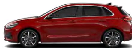
Ultimate Red Metallic