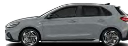
Shadow Grey nur für N Line