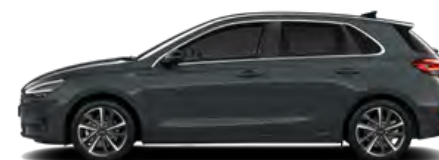
Cypress Green Pearl