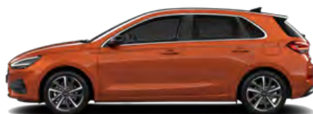
Jupiter Orange Metallic