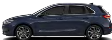
Sailing Blue Pearl