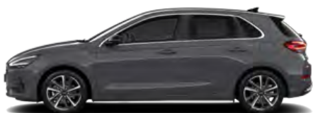
Ecotronic Grey Pearl