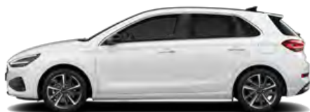
Serenity White Pearl