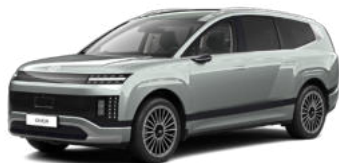
Celadon Gray Metallic