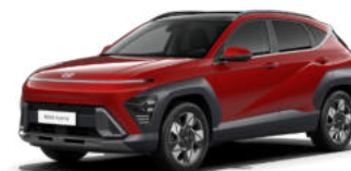
Ultimate Red Metallic Kontrastdach verfügbar