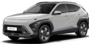
Quantum Gray Pearl Kontrastdach verfügbar