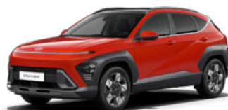
Soultronic Orange Pearl Kontrastdach verfügbar nicht verfügbar für N Line