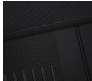
Comfort Line Stoffpolsterung Schwarz