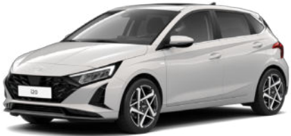
Lumen Gray Pearl Kontrastdach verfügbar