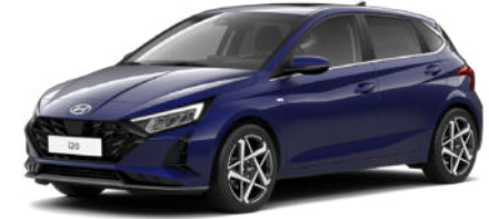
Vibrant Blue Pearl Kontrastdach verfügbar