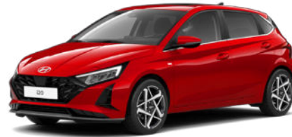
Fierce Red Pearl Kontrastdach verfügbar