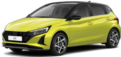
Lucid Lime Metallic Kontrastdach verfügbar