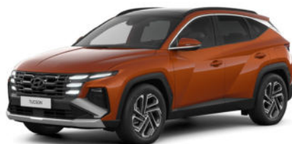
Jupiter Orange Metallic Kontrastdach verfügbar nicht für N Line verfügbar