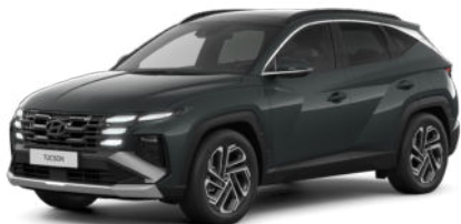
Cypress Green Pearl Kontrastdach verfügbar nicht für N Line verfügbar