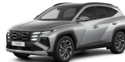
Shimmering Silver Metallic Kontrastdach verfügbar