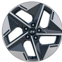
Comfort Line 18" Leichtmetallfelge