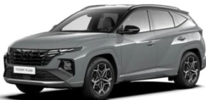
Shadow Gray Kontrastdach verfügbar nur für N Line