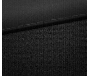
Smart Line Stoff Schwarz