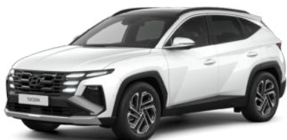
Serenity White Pearl Kontrastdach verfügbar