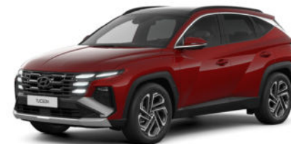
Ultimate Red Metallic Kontrastdach verfügbar