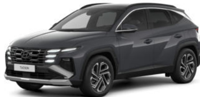
Ecotronic Gray Pearl Kontrastdach verfügbar