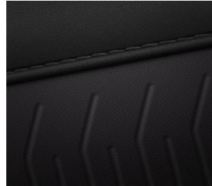
Comfort Line Stoff-/ Leder 2) Schwarz