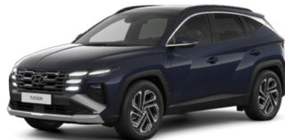
Sailing Blue Pearl Kontrastdach verfügbar nicht für N Line verfügbar