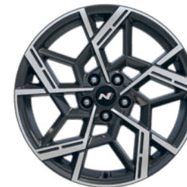
N Line 19" Leichtmetallfelge