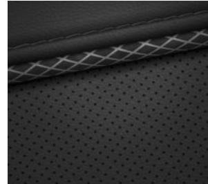
Comfort Line (optional) Leder 2) Schwarz