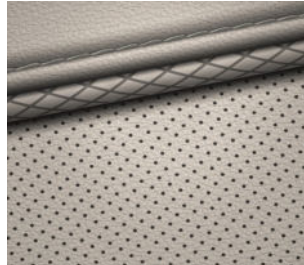
Comfort Line (optional) Leder 2) Hellgrau