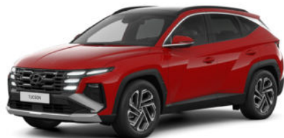
Engine Red Kontrastdach verfügbar