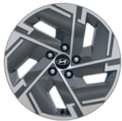
Smart Line 17" Leichtmetallfelge