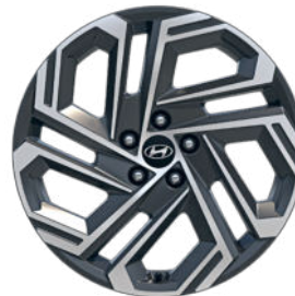
Comfort Line (optional) 19" Leichtmetallfelge