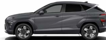
Ecotronic Gray Pearl