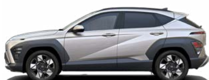
Shimmering Silver Metallic nicht verfügbar für Hybrid