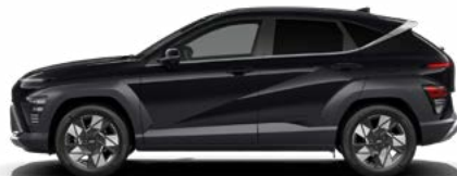
Abyss Black Pearl nicht verfügbar für Hybrid