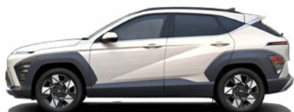
Serenity White Pearl nicht verfügbar für Hybrid