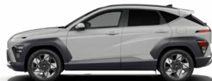
Cyber Gray Metallic