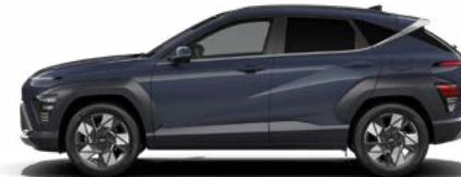
Denim Blue Pearl