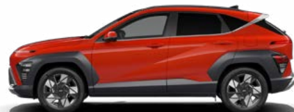
Soultronic Orange Pearl nicht verfügbar für Benzin und N Line