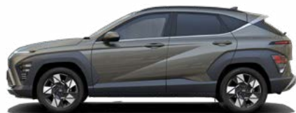
Amazon Gray Metallic nicht verfügbar für Hybrid und N Line