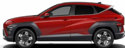
Ultimate Red Metallic nicht verfügbar für Benzin