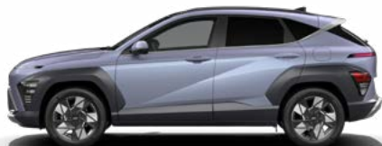
Meta Blue Pearl nicht verfügbar für N Line