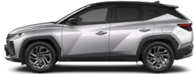
Shimmering Silver Metallic