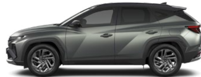
Pine Green Matt