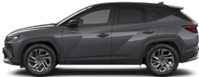
Ecotronic Grey Pearl