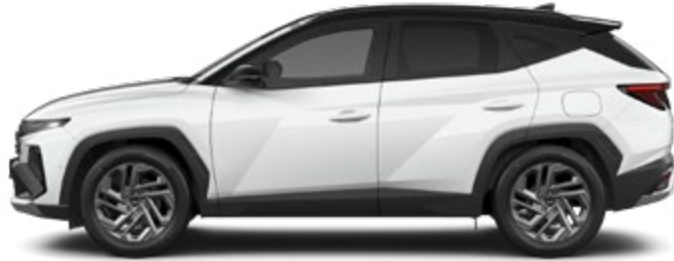
Serenity White Pearl