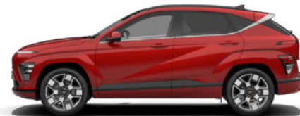
Ultimate Red Metallic