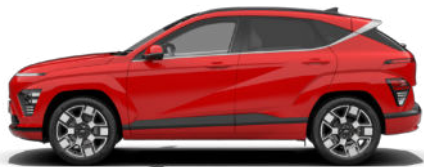
Engine Red Solid