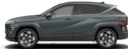
Cypress Green Pearl