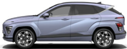
Meta Blue Pearl