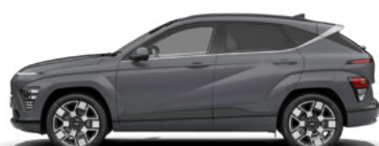
Ecotronic Gray Pearl