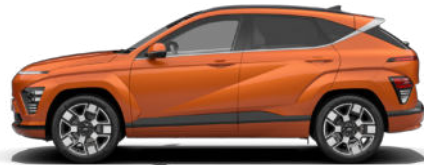
Jupiter Orange Metallic