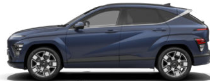
Sailing Blue Pearl