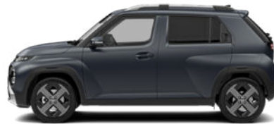
Dusk Blue Matte nicht für Cross Line