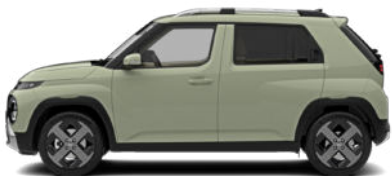
Buttercream Yellow Pearl nicht für Cross Line