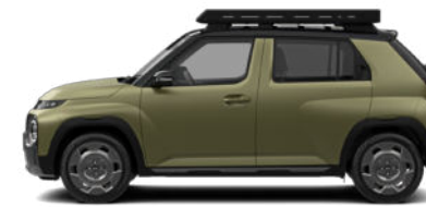
Amazonas Green Matte nur für Cross Line

Pflegehinweis bei Fahrzeugen mit Mattlackierung: Autowaschanlagen mit drehenden Bürsten dürfen nicht verwendet werden, da sie die Oberfläche Ihres Fahrzeugs beschädigen können. Dampfreiniger, die die Fahrzeugoberfläche mit hohen Temperaturen reinigen, können dazu führen, dass Öl auf dem Lack haftet und schwer zu entfernende Flecken bildet. Verwenden Sie bei der Autowäsche ein weiches Tuch (z. B. Mikrofaser Tuch oder Schwamm) und trocknen Sie das Auto mit einem Mikrofaser Tuch. Wenn Sie Ihr Auto von Hand waschen, sollten Sie keinen Reiniger verwenden, der mit einer Wachsbehandlung abschließt. Wenn die Fahrzeugoberfläche stark verschmutzt ist (Sand, Schmutz, Staub, Verunreinigungen usw.), spülen Sie die Oberfläche zunächst mit Wasser, bevor Sie das Fahrzeug waschen. Verwenden Sie keinen Lackschutz (wie Schaumwaschmittel), Scheuermittel oder Politur. Wurde Wachs aufgetragen, entfernen Sie das Wachs umgehend mit einem Silikonreiniger. Wenn Teer oder Teerverunreinigungen vorliegen, verwenden Sie zu deren Entfernung einen geeigneten Teerentferner. Achten Sie jedoch darauf, nicht zu viel Druck auf die Lackierung auszuüben.