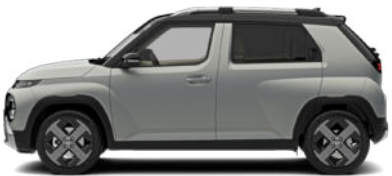
Aero Silver Matte Kontrastdach verfügbar