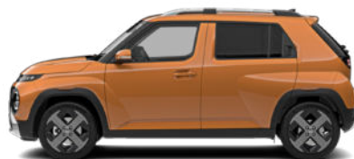
Sienna Orange Metallic Kontrastdach verfügbar nicht für Cross Line