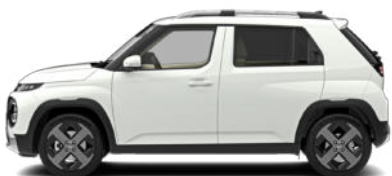
Atlas White Kontrastdach verfügbar