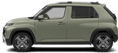
Bijarim Khaki Matte nicht für Cross Line