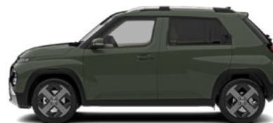
Tomboy Khaki Kontrastdach verfügbar nicht für Cross Line