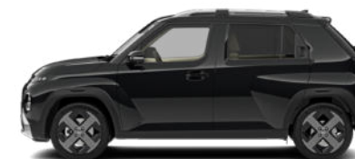
Abyss Black Pearl