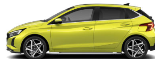
Lucid Lime Metallic Kontrastdach verfügbar