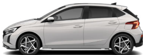
Lumen Gray Pearl Kontrastdach verfügbar