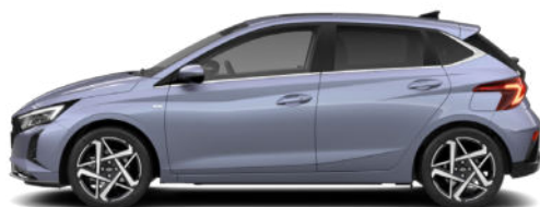
Meta Blue Pearl Kontrastdach verfügbar