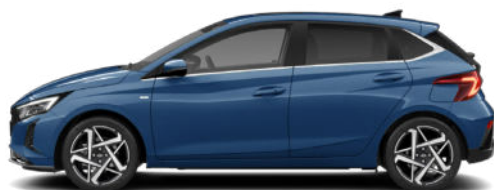
Vibrant Blue Pearl Kontrastdach verfügbar