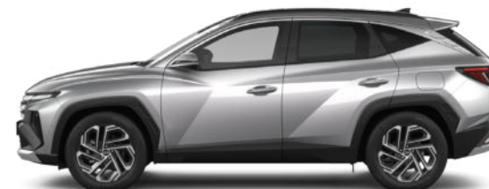
Shimmering Silver Metallic Kontrastdach verfügbar