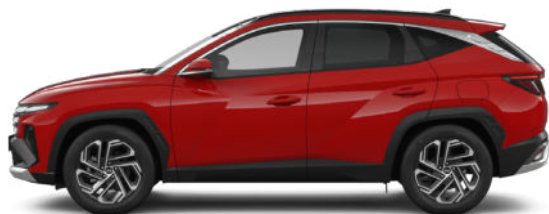
Engine Red Kontrastdach verfügbar