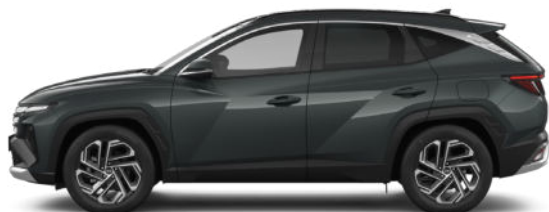
Cypress Green Pearl Kontrastdach verfügbar nicht für N Line verfügbar