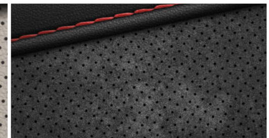
Leder-/Alcantara Kombination N Line