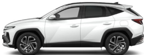
Serenity White Pearl Kontrastdach verfügbar