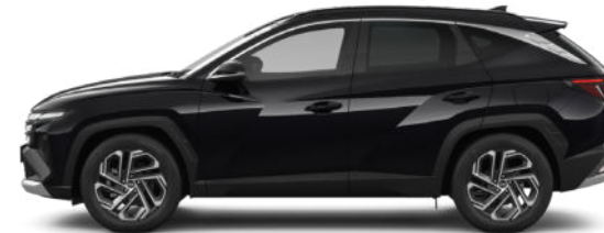
Abyss Black Pearl