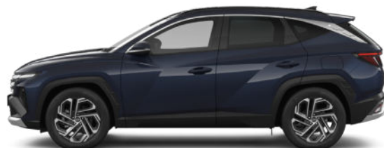
Sailing Blue Pearl Kontrastdach verfügbar nicht für N Line verfügbar