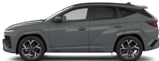
Shadow Grey Kontrastdach verfügbar nur für N Line verfügbar