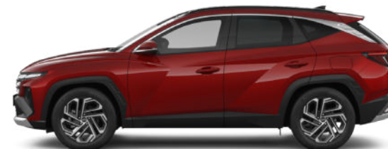
Ultimate Red Metallic Kontrastdach verfügbar