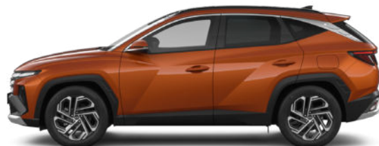
Jupiter Orange Metallic Kontrastdach verfügbar nicht für N Line verfügbar