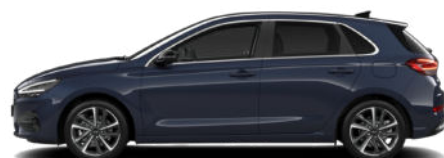
Sailing Blue Pearl