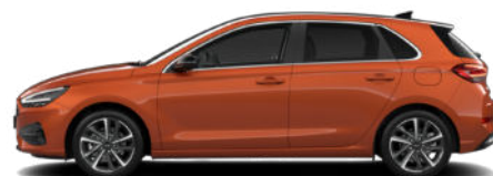
Jupiter Orange Metallic