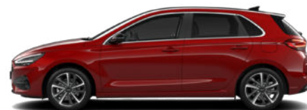
Ultimate Red Metallic