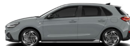
Shadow Grey nur für N Line