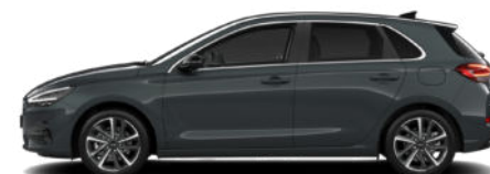
Cypress Green Pearl