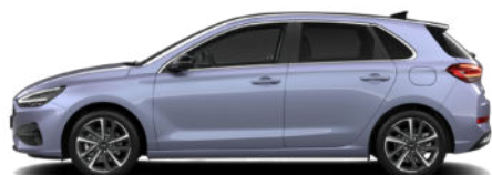
Meta Blue Pearl