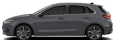
Ecotronic Grey Pearl