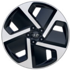
Trend Line 19" Leichtmetallfelge