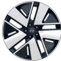
Prestige Line 20" Leichtmetallfelge