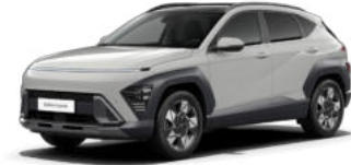
Shimmering Silver Metallic Kontrastdach verfügbar