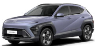
Meta Blue Pearl Kontrastdach verfügbar nicht verfügbar für N Line