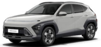
Quantum Gray Pearl Kontrastdach verfügbar