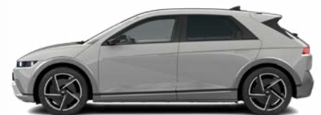
Cyber Gray Metallic