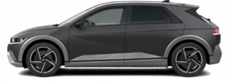
Ecotronic Gray Matte