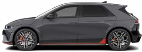
Ecotronic Gray Pearl