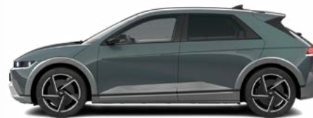
Digital Teal-Green Pearl nicht für N Line