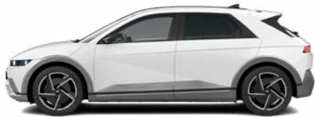
Aufpreis € 390,- Atlas White