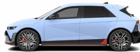
Performance Blue Matte