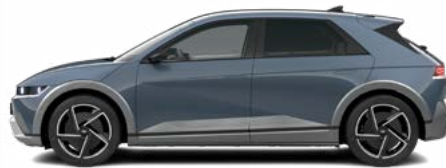
Lucid Blue Pearl nicht für N Line