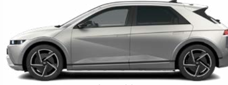
Gravity Gold Matte