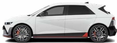
Atlas White Matte