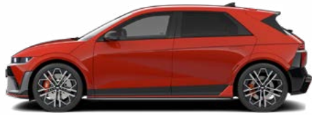
Soultronic Orange Pearl