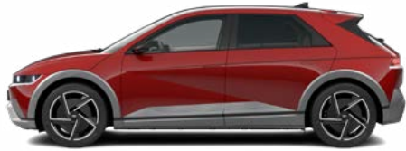
ohne Aufpreis Ultimate Red Metallic