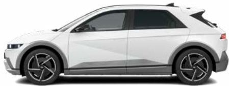
Atlas White Matte