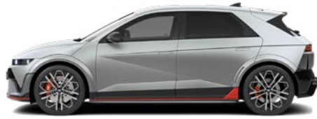
Gravity Gold Matte