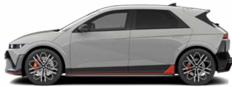
Cyber Gray Metallic