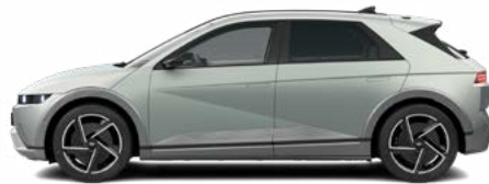
Celadon Gray Matte nicht für N Line