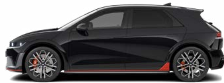
Abyss Black Pearl