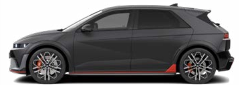
Ecotronic Gray Matte