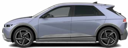
Meta Blue Pearl nicht für N Line