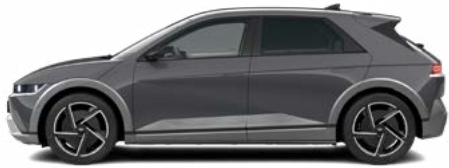
Ecotronic Gray Pearl