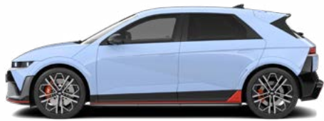
Performance Blue Glossy