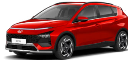
Fierce Red Pearl Kontrastdach verfügbar