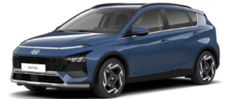
Vibrant Blue Pearl