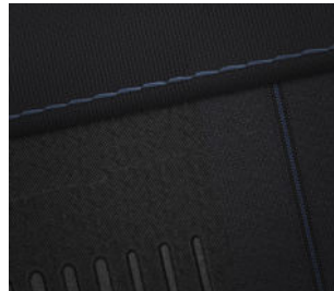
Comfort Line (optional) Stoffpolsterung mit Kontrastnähten in Vibrant Blue