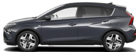
Aurora Gray Pearl