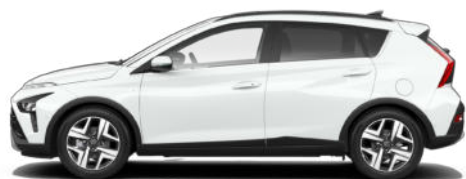
Atlas White Kontrastdach verfügbar