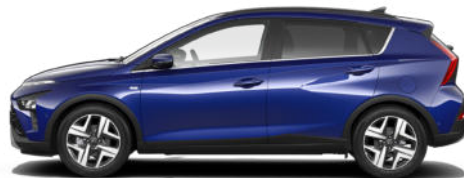
Intense Blue Pearl Kontrastdach verfügbar