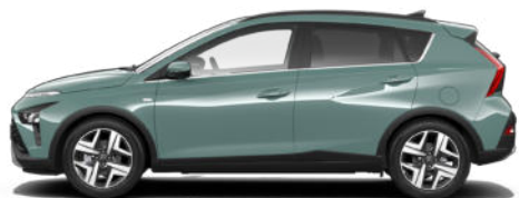
Mangrove Green Pearl Kontrastdach verfügbar