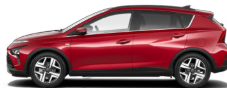
Dragon Red Pearl Kontrastdach verfügbar