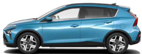
Aqua Turquoise Metallic