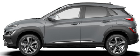
Galactic Gray Metallic Kontrastdach verfügbar