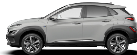
Cyber Gray Metallic Kontrastdach verfügbar