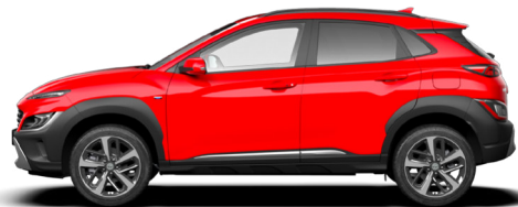
Ignite Red Kontrastdach verfügbar