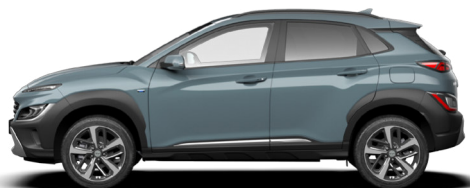
Jungle Green Pearl* Kontrastdach verfügbar