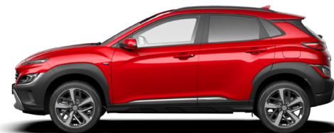
Pulse Red Pearl* Kontrastdach verfügbar