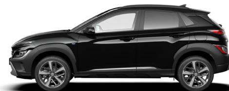
Phantom Black Pearl