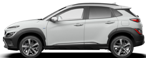
Atlas White Kontrastdach verfügbar