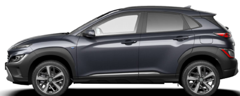
Dark Knight Gray Pearl* Kontrastdach verfügbar