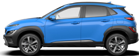
Surfy Blue Metallic* Kontrastdach verfügbar