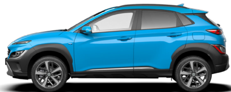
Dive Blue Kontrastdach verfügbar