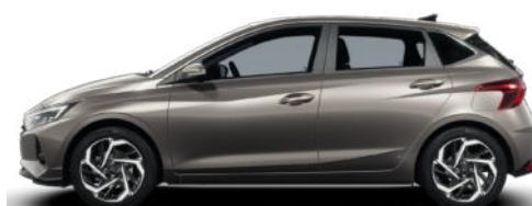
Elemental Brass Metallic