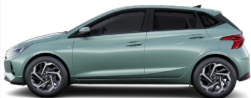
Mangrove Green Pearl

Kontrastdach verfügbar / nicht für N Line