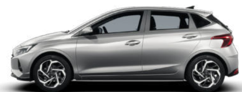
Sleek Silver Metallic