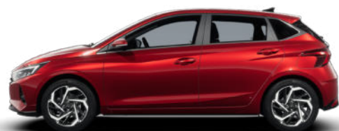
Dragon Red Pearl