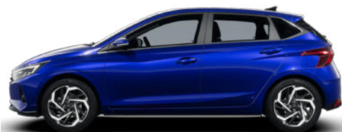
Intense Blue Pearl