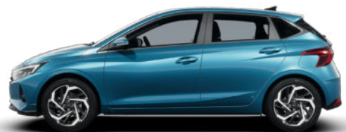
Aqua Turquoise Metallic