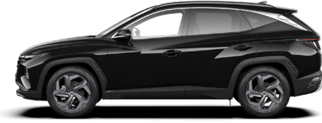
Phantom Black Pearl