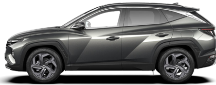
Amazon Gray Metallic (nicht für N Line)