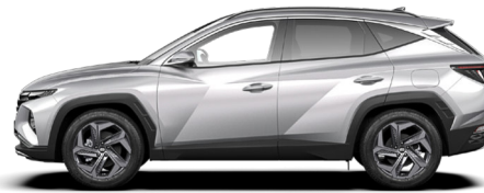
Shimmering Silver Metallic