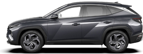
Dark Knight Gray Pearl