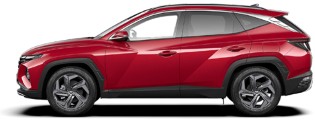
Sunset Red Pearl