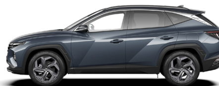
Dark Teal Metallic (nicht für N Line)