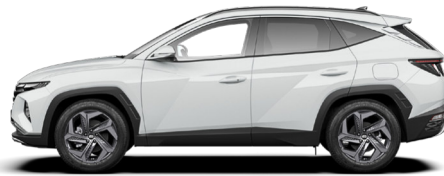
Serenity White Pearl