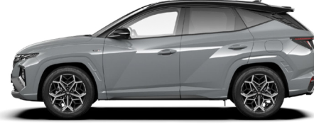
Shadow Gray (exklusiv für N Line)