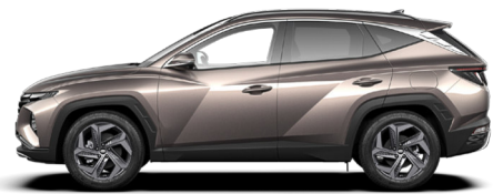
Silky Bronze Metallic (nicht für N Line)