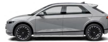
Cyber Gray Metallic