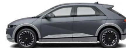
Shooting Star Gray Matte