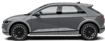
Galactic Gray Metallic