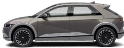
Mystic Olive-Green Pearl