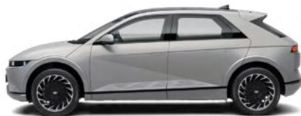
Gravity Gold Matte