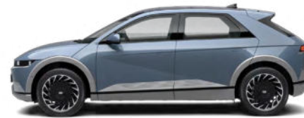
Lucid Blue Pearl