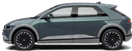
Digital Teal-Green Pearl