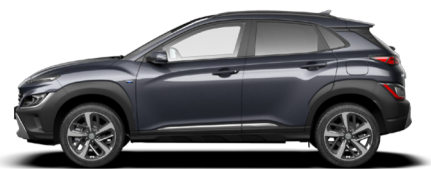
Dark Knight Gray Pearl Kontrastdach verfügbar