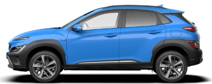
Surfy Blue Metallic Kontrastdach verfügbar