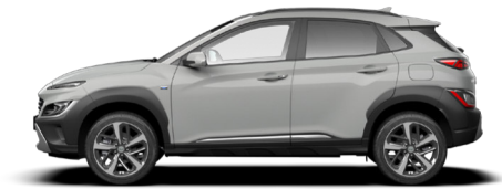
Cyber Gray Metallic Kontrastdach verfügbar