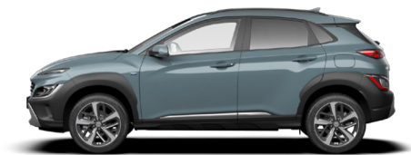
Jungle Green Pearl Kontrastdach verfügbar