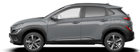
Galactic Gray Metallic Kontrastdach verfügbar