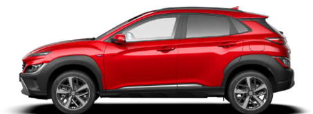
Pulse Red Pearl Kontrastdach verfügbar