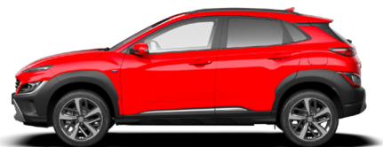
Ignite Red Kontrastdach verfügbar