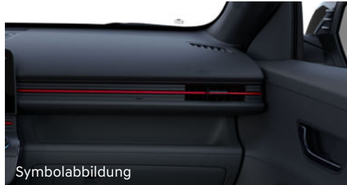
Symbolabbildung N Line Interieur Schwarz