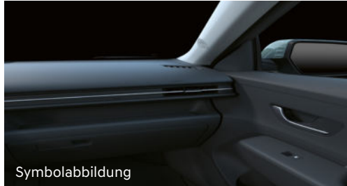
Symbolabbildung Smart / Comfort Line Interieur Schwarz