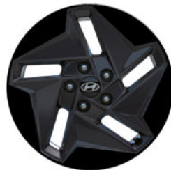
Smart Line (optional) 17" Leichtmetallfelge in Schwarz