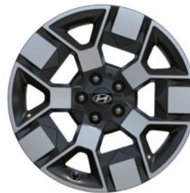
Comfort Line (optional) 19" Leichtmetallfelge