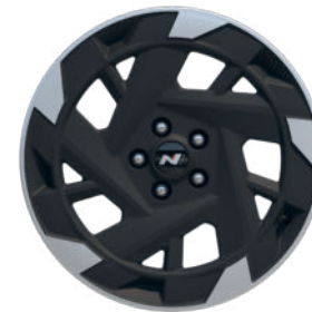
N Line 19" Leichtmetallfelge