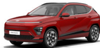
Ultimate Red Metallic Kontrastdach verfügbar