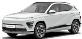
Serenity White Pearl Kontrastdach verfügbar