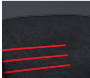
N Line Leder-/ Alcantara 9) Kombination