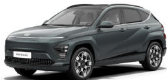
Cypress Green Pearl Kontrastdach verfügbar nicht verfügbar für N Line