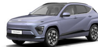
Meta Blue Pearl Kontrastdach verfügbar nicht verfügbar für N Line