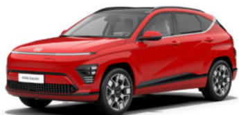
Engine Red Kontrastdach verfügbar