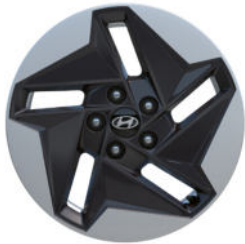
Smart Line 17" Leichtmetallfelge