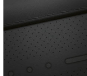
Comfort Line (optional) Leder 2) Schwarz