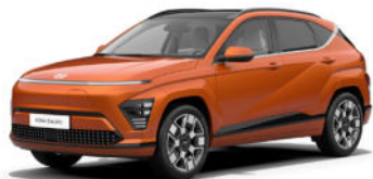
Jupiter Orange Metallic Kontrastdach verfügbar nicht verfügbar für N Line