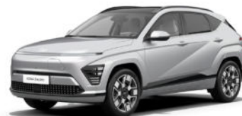
Shimmering Silver Metallic Kontrastdach verfügbar