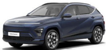
Sailing Blue Pearl Kontrastdach verfügbar