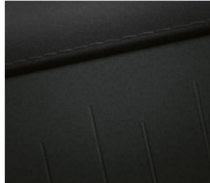
Smart Line Stoff Schwarz