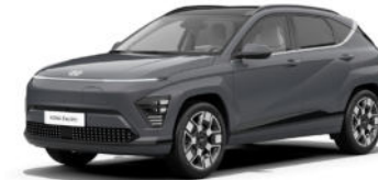
Ecotronic Gray Pearl Kontrastdach verfügbar