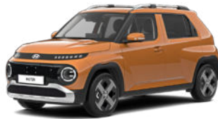
Sienna Orange Metallic nicht für Cross Line