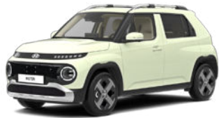
Buttercream Yellow Pearl nicht für Cross Line