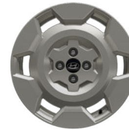
Cross Line 17" Leichtmetallfelge